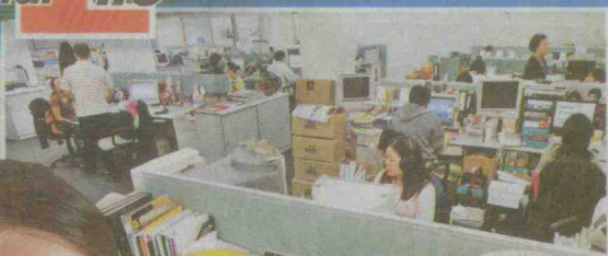
無論高、中、低階層的員工，都難受金融海嘯的影響。