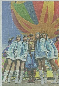
▶百變盛智文之飛機師造型

他思考時天馬行空，不過起居習慣又極有規律，每早5點準時起床玩gym，然後喝Xango汁，不煙不酒。眼見周遭城市大興土木，新加坡有環球影城、上海有世博、廣州有電視塔、博物館和歌劇院，自命「Hong Kong boy」的他肉緊地說：「2014年連接兩地的大橋完工，商貿生態勢將改變，香港一定要交出創新價值，若貪睡只會被其他城市比下去。」為公職出頭，為生意頻撲，24/7的工作模式教曉王也累了，講到成都蘭桂坊時神采飛揚，不說話的片刻，眼裏卻盡是勞累。